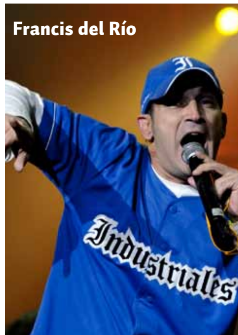
Francis del Río Cantante, compositor y productor. Discografía: «Sentimiento», «Sol» y «Vanidadede vanidades». www.youtube.com/watch?v=iC36bKSsuo