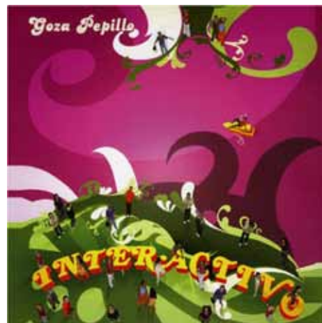
«Goza pepillo», 2005 Gran Premio Cubadisco, en las categorías Fusión y Ópera prima