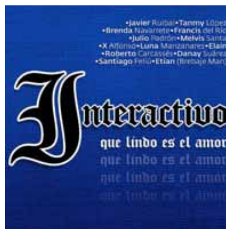
«Qué lindo es el amor», 2014 Premio Cubadisco en la categoría Fusión