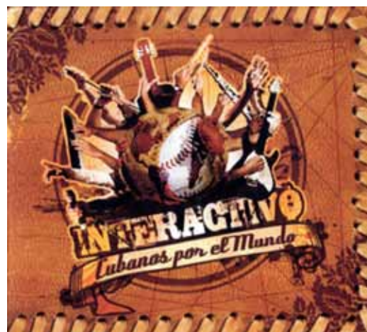
«Cubanos por el mundo», 2010